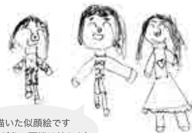
娘が描いた似顔絵です (中央が私、両端は娘たち)

昨年度は新組織関連とハイブリッド開催の定期会員集会のために、学ぶことの多い年でした。COVID-19の影響もあり、神戸YWCAの活動も新たな取り組みをたくさん試みしました。ユースとシニアの中間の世代である私が、新しいことと今まで培ってきたよさを融合させて、神戸