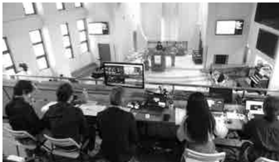
礼拝堂2階に設置されたスタジオと神戸聖愛教会「でんどうず」+αチーム

13:30になると、緊張感に満ちた礼拝堂にオーボエとピアノの生演奏が豊かに響き、厳かに式典が始まりました。