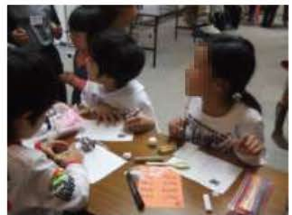
<いろいろと調べるヒトたち>