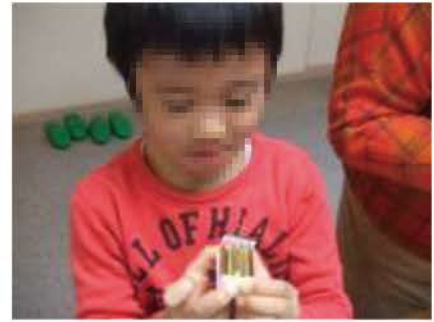
<うまく作れたヒトたち>