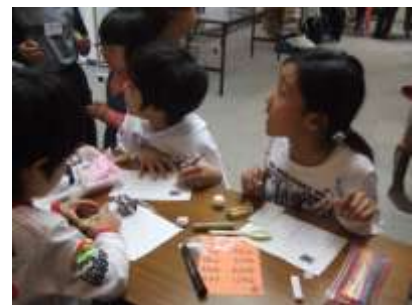
<いろいろと調べるヒトたち>