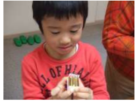
<くまく作れたヒトたち>